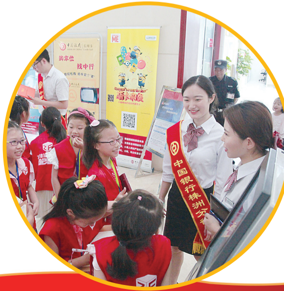
开展“小小银行家”活动。

截至今年6月,中国银行株洲分行在岗员工619人,网点34个,营销和服务网络覆盖全市,业务种类齐全,服务手段先进、资金实力雄厚的国有控股商业银行,资产规模达到300亿元,累计投放贷款达1000亿元。