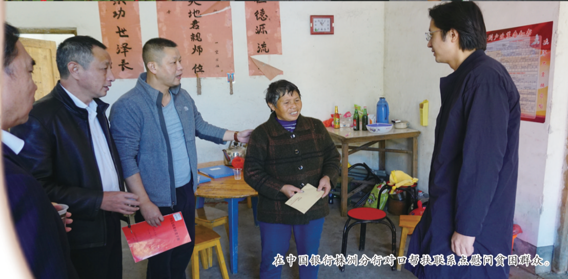
在中国银行株洲分行对口帮扶联系点慰问贫困群众。