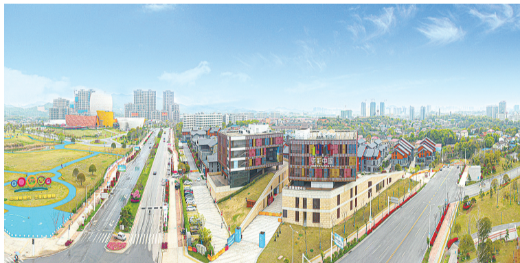
醴陵五彩陶瓷小镇。