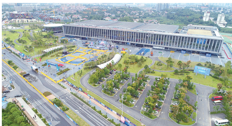
中国陶瓷谷国际会展中心。