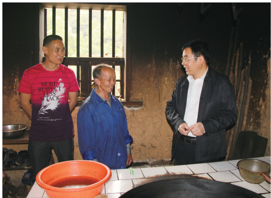
黄诗燕用宝贵生命诠释共产党员的初心使命。

开展党史学习教育以来,我市举行“百年风华·株洲力量”党史学习教育专题演讲比赛,选手们用充满激情的语言,生动鲜活的事例,讲故事、谈成就、说变化、谈感受。在建党百年华诞之际,我们把红色故事讲给您听。