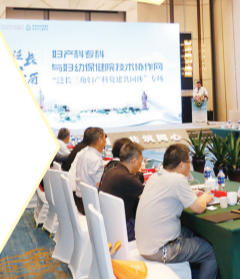
市妇幼保健院产科党建共同体“泛长三角”妇产党建共同体”专场活动。