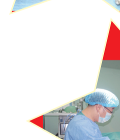
市妇幼保健院专家正在进行手术。