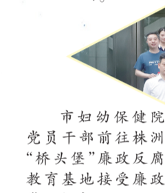
市妇幼保健院党委干部前往株洲“桥头堡”廉政教育基地接受廉政警示教育。