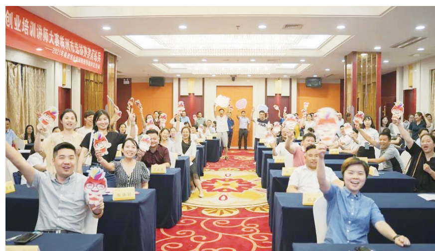
创业培训师等级评定培训现场气氛热烈。

株洲日报·掌上株洲讯(记者/马文章 通讯员/任纳)“这是一场精英之间的头脑风暴,更是一次难得的取经机会。”日前,120名全市创业培训师齐聚一堂,参加株洲市创业培训师等级评定活动。此次活动邀请了叶仁平、张弦、晏兵和梁峰等4位国家级培训师担任考评活动的评审专家,为考评工作指点迷津。