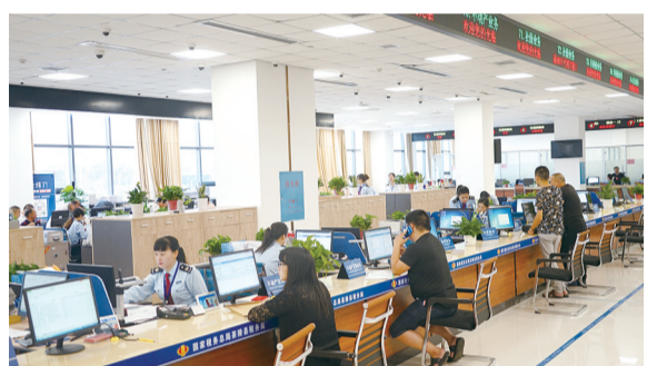
宽敞明亮的茶陵县政务服务中心

如今,湘赣边区域合作发展示范区建设,又为茶陵文旅产业发展注入了一针强心剂。茶陵县以红色旅游为媒,抓住“两山”铁路开通契机,打造湘赣边红色旅游创新示范区。