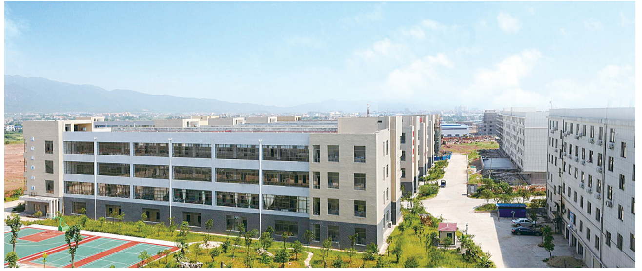
茶陵经开区标准厂房