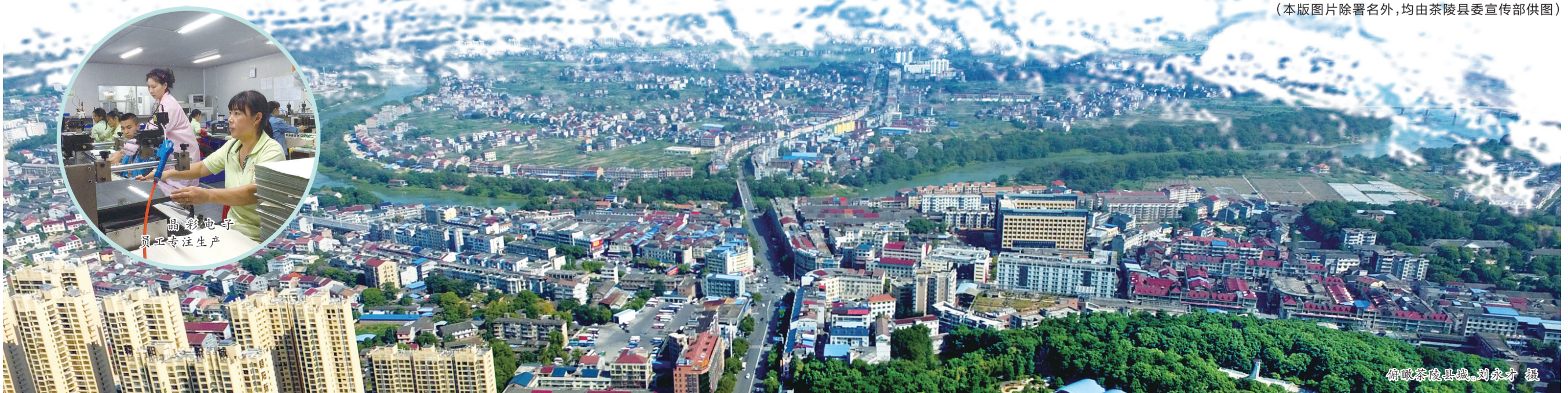
俯瞰茶陵县城。