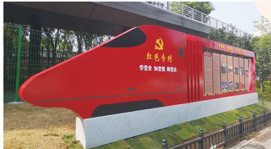
乐水园党史教育公园内的“党史红色专列”。

株洲日报·掌上株洲讯(记者/张诗慧 通讯员/宋金凯) 6月24日,记者从芦淞区城管局园林绿化中心了解到,位于株洲大桥河东段桥下两侧边,总面积8020平方米的我市首个党史教育公园——乐水园已开园。