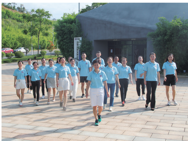
▲朝气蓬勃的教师团队。

二中青龙湾小学去年已经投用招生,一站式教育培训共享平台伟大大学库已经开学,伟大幼儿园、青龙湾公办幼儿园已经开园或建成,蓝谷城堡幼儿园正在建设。作为株洲城市向南拓展的重要空间,青龙湾正在成为株洲优质教育的集聚高地。