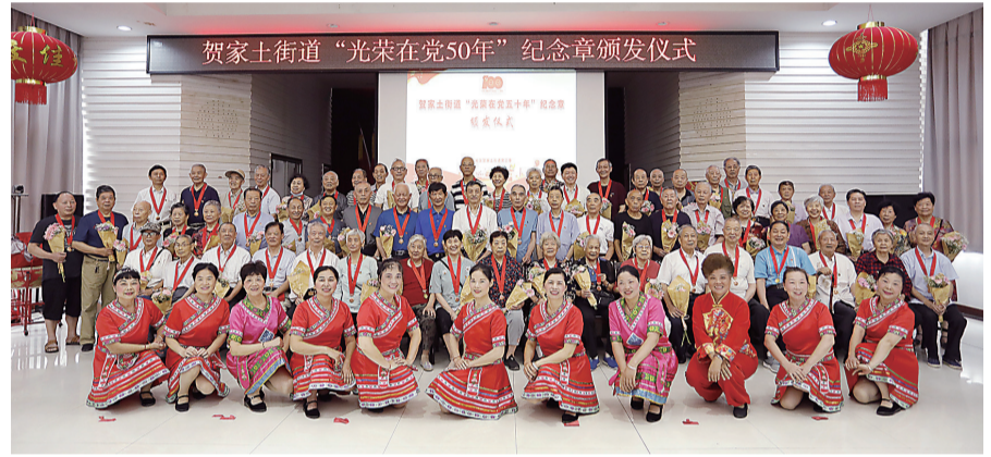
获得“光荣在党50年”纪念章的老党员合影。

株洲日报·掌上株洲讯(记者/肖捷)6月22日,荷塘区近百人来到株洲烈士纪念馆纪念碑前广场,举行简单而庄严的新党员集中宣誓暨“光荣在党50年”纪念章颁发仪式。