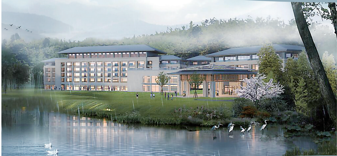
中国·炎陵神农百草药王谷科技谷效果图

6月21日，我市又有122个重点项目集中开工，总投资776亿元，年计划投资145亿元。一个个好项目接连落地，一波波好消息接踵而至，点燃高质量发展的株洲新引擎，为党的百年华诞增光添彩。