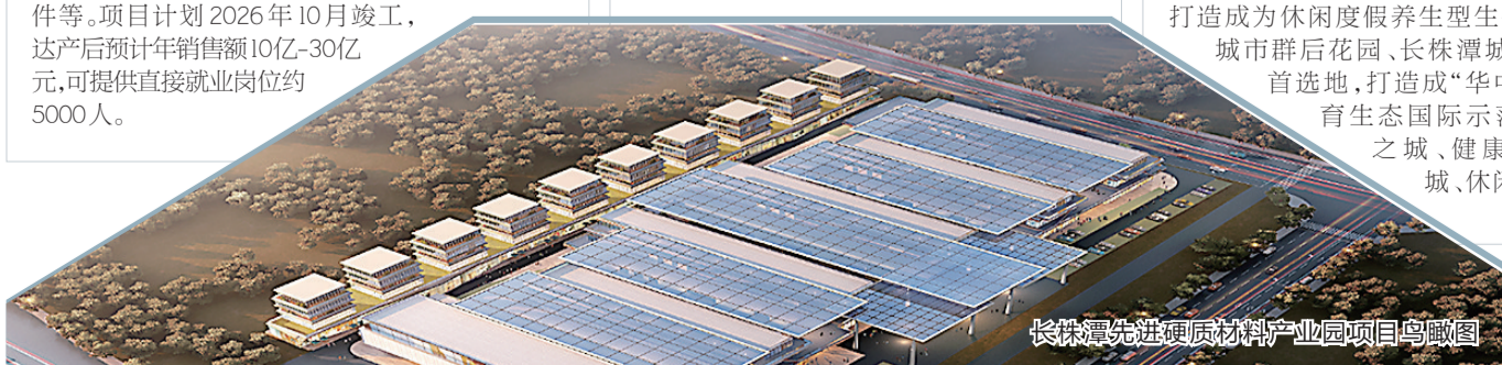
长株潭先进硬质材料产业园项目鸟瞰图

填补株洲专业的先进硬质材料产业贸易市场空缺，瞄准打造世界领先、中国一流的先进硬质材料产业集群关键环节的目标，长株潭先进硬质材料产业园拟建设产品展示、销售和培训等功能于一体的展示交易中心，销售产品主要为硬质合金、数控刀具、数控装备产品、模具及配件、自动化成套及零部件等。项目计划2025年10月竣工，达产后预计年销售额10亿-30亿元，可提供直接就业岗位约5000人。