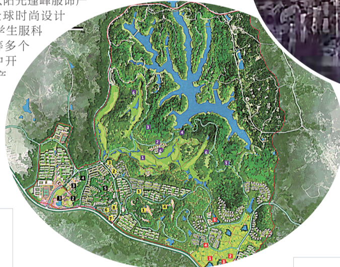
中核云峰湖健康谷工程效果图