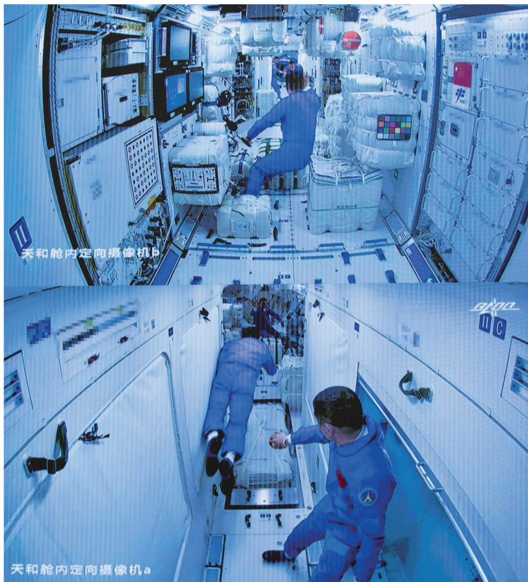
天和舱内定向摄像机B

停靠空间站期间,神舟十二号载人飞船也具备随时紧急撤离空间站,安全返回地球的能力。 神舟十二号载人飞船配置了两套降落伞,飞船返回舱冲向地球表面时,当一套出现问题时,另一套降落伞可以随时顶上,起到减速缓冲的作用。 此外,神舟团队携带两艘飞船进场,由一艘飞船作为发射船的备份,是遇到突发情况时航天员的生命救援之舟。在前一发载人飞船发射时,后一发载人飞船在发射场待命,具备8.5天应急发射能力及太空救援的能力。