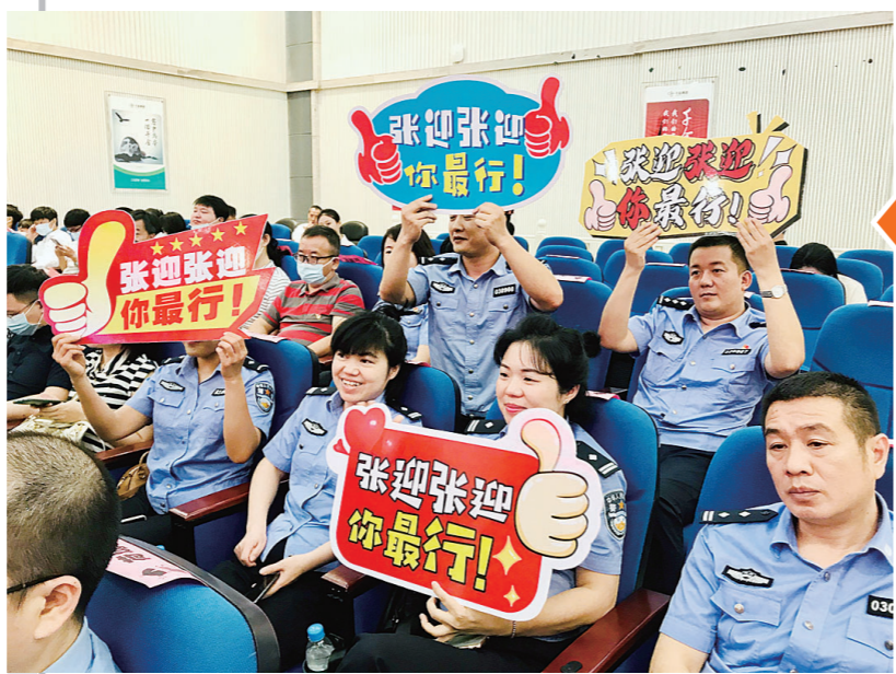
台下观众纷纷举牌为自己喜欢的选手加油助威。

株洲日报·掌上株洲讯(记者/邹家虎 通讯员/王玲) 6月17日,“百年风华 株洲力量”党史学习教育专题演讲比赛半决赛在千金药业会议室举行。25名选手经过激烈角逐,最终决出10名选手晋级决赛。