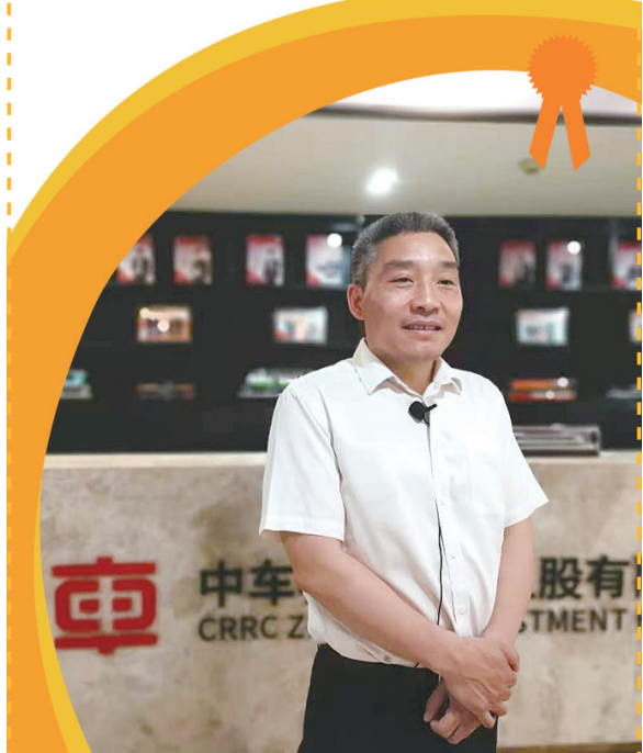
中车控股党委书记、董事长胡志军

面向“十四五”,胡志军希望带领中车控股不断创新、突破,持续裂变壮大。他说:“我们的使命就是立足轨道交通产业链,不断寻找新的突破方向,做好人才链、产业链、技术链的融合嫁接,在新方向里找到前进的指向灯。”