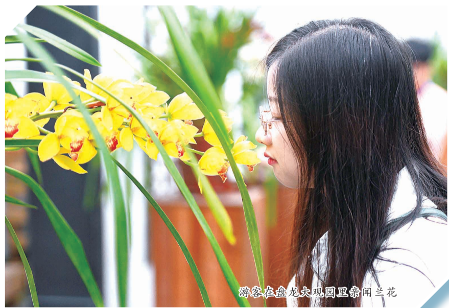
游客在盘龙尖公园里赏闻兰花