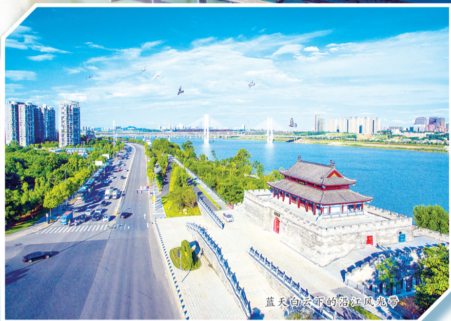
蓝天白云下的沿江风光带