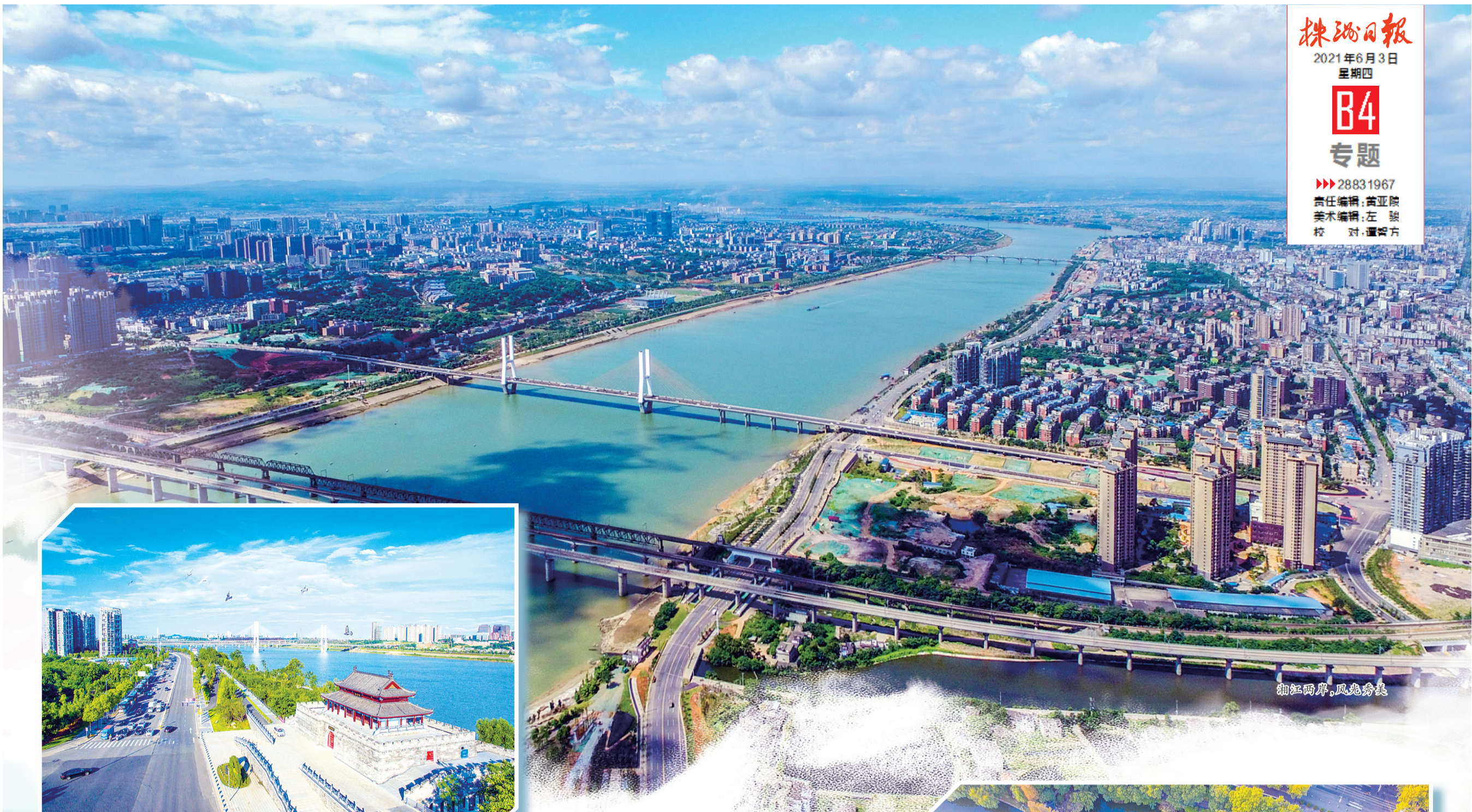
湘江两岸,风光秀美