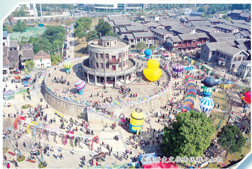
嘉靖历史文化街区游人如织