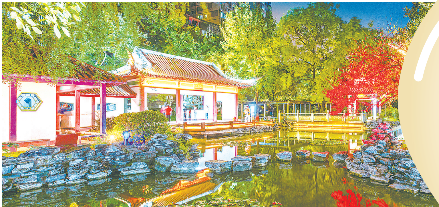
“微亮化”后的沈家湾怡心花园的小游园，成了居民夜间跳舞休憩的好地方

株洲在全省率先实施的“微亮化”，一大初衷便是解决这一问题。经过一年的努力，“微亮化”如何推动城市夜景照明均衡发展，又能否进一步盘活夜资源？