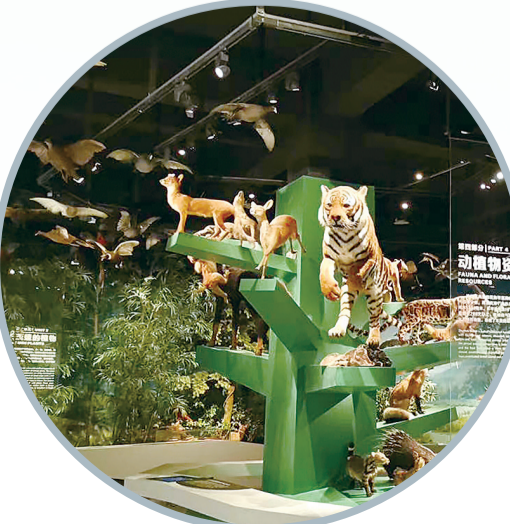
上百种本土动植物标本组成一棵巨大的“生命之树”,华南虎占据“C”位。