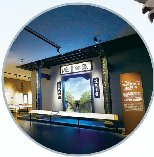
株洲博物馆通过多媒体形式展示湘江书院。

如今,它重新扬帆,道尽了株洲的前世今生,重新诠释这座工业之城。近期,它又获国奖,展陈从全国近3万个陈列展览中脱颖而出,跻身全国前列,荣获“全国博物馆十大陈列展览精品推介”优胜奖。