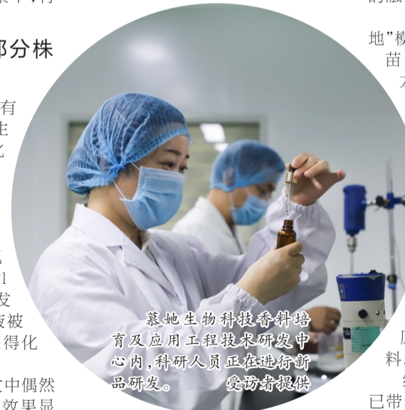
慕她生物科技研发培育及应用工程研发团队中心内,科研人员正在进行新品研发。

2年前,通过“万企帮万村”行动,慕她生物科技发展有限公司(以下简称“慕她生物”)带着6万