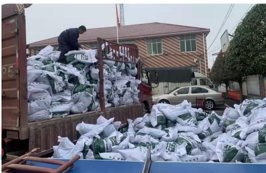
▲村里负责购买肥料和茶树苗,帮助村民改种油茶林。