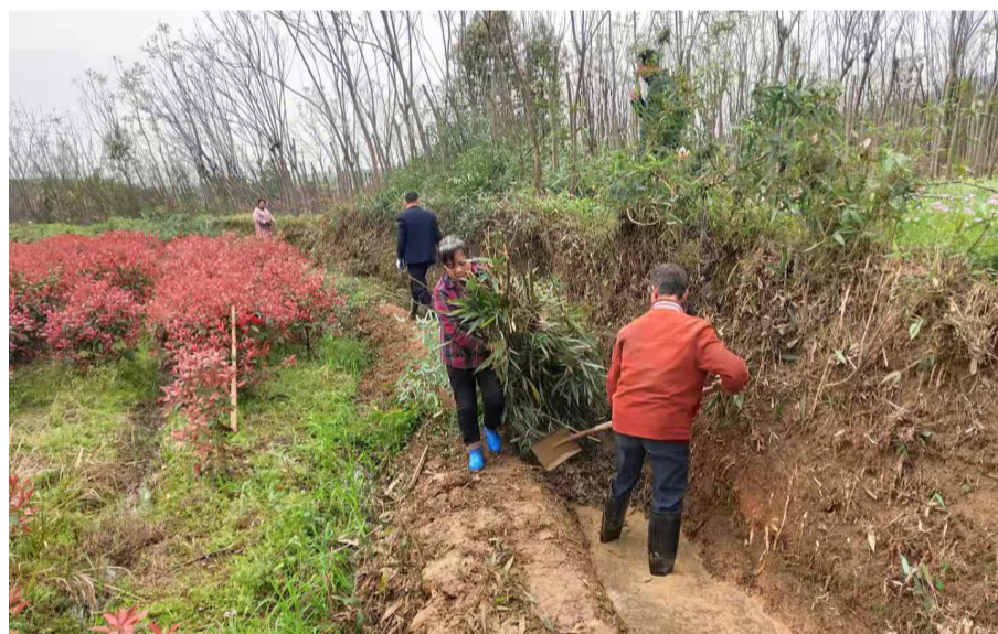
▲为服务村民复耕种粮,樟霞村进行水渠修缮。

…… 黄四平解说着村子的“十四五”发展规划,描绘着村寨的发展美景,言辞间充满着对下一步如何衔接乡村振兴的决心与信心。