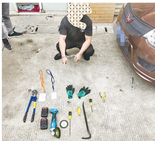
现场被收缴的作案工具(前)及作案车辆(右)。