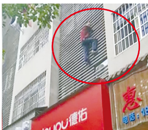
发现楼下被民警包围,嫌疑人挂在墙上进退两难。

株洲日报·掌上株洲讯(记者/沈全华 通讯员/陈双容) 一件旧衣,一份爱心,旧衣物回收是一项环保公益活动,却被“黑手偷走卖钱”。得知这个结局,捐赠爱心的你,心情会怎样?5月25日,经开公安分局学林派出所迅速出击,抓获两名盗窃旧衣物的犯罪嫌疑人。