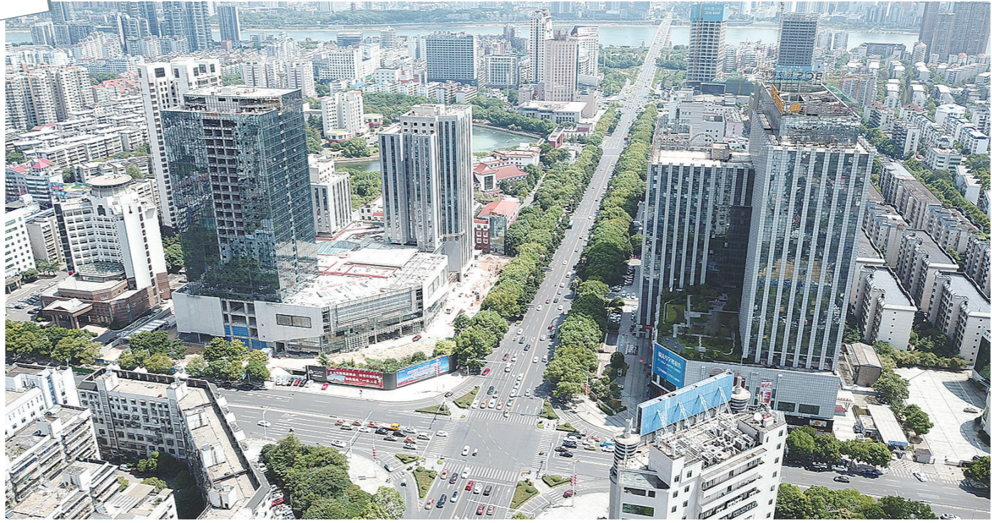
航拍天台路(资料图)。

1995年,天台路最西端,占地17.7公顷的神农城广场(原名炎帝广场)动工建设。这个集商贸、休闲于一体的文化广场,规模之大、功能之多、地下管线之复杂,在株洲市政史上前所未有,一时间风头无两。 工程背后的考量不言而喻:是时候再造一条株洲商业新“动脉”。 “市政府率先搬到河西,这是强有力的导向。”1994年市政府搬迁后,天台路两