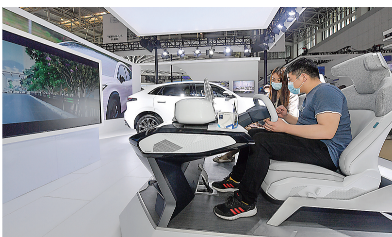
5月20日,在天津梅江会展中心,观众体验智慧驾驶座舱。

要技术路线。”中国科学院院士周济点睛人工智能对国家发展的重要意义。人工智能赋能,中国智造已然腾飞。