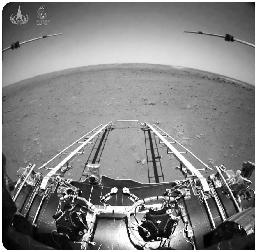
该图由火星车前避障相机拍摄,正对火星车前进方向。

新华社北京5月19日电 5月19日,国家航天局发布我国首次火星探测任务天问一号探测器着陆过程两器分离和着陆后火星车拍摄的影像。图像中,着陆平台驶离坡道以及祝融号火星车太阳翼、天线等机构展开正常到位。