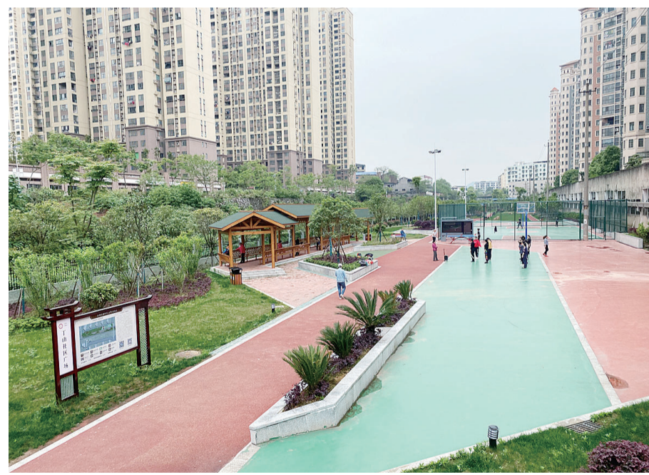
石峰区丁山社区广场改造后，已成为文体设施齐全的“社区游园”。