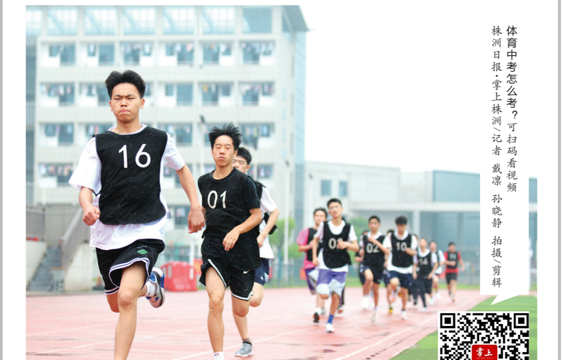
株洲日报·掌上株洲讯