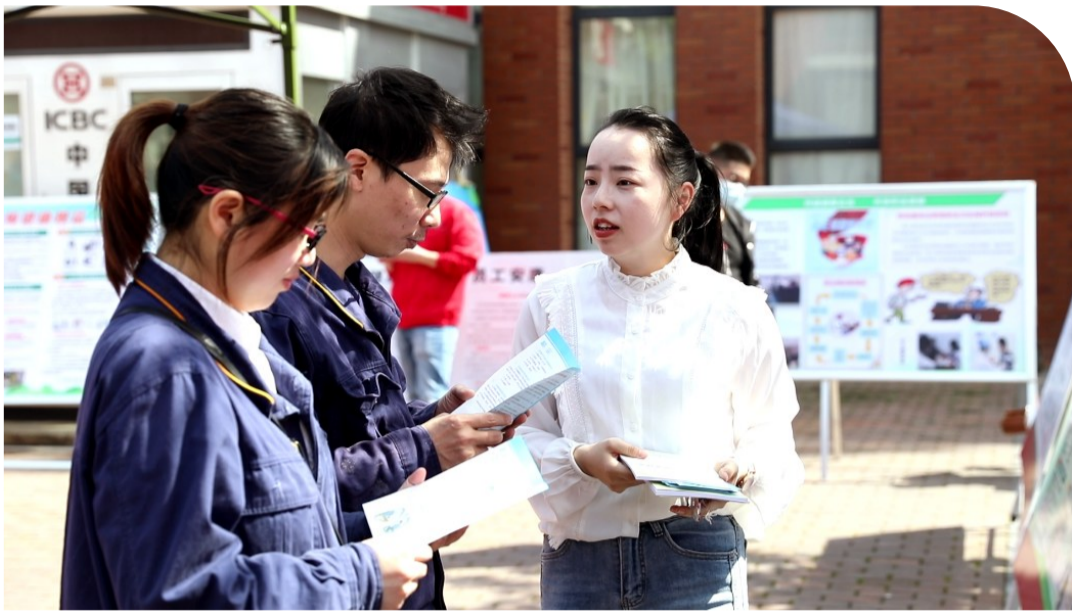
《职业病防治法》宣传周活动