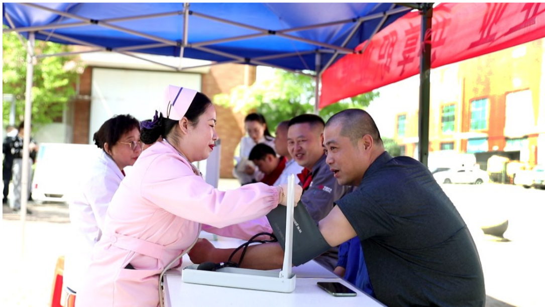
《职业病防治法》宣传周活动

个人防护和个人卫生:佩戴防尘面具,如防尘安全帽、防尘口罩、送风头盔、送风口罩等,讲究个人卫生,勤换工作服,勤洗澡。