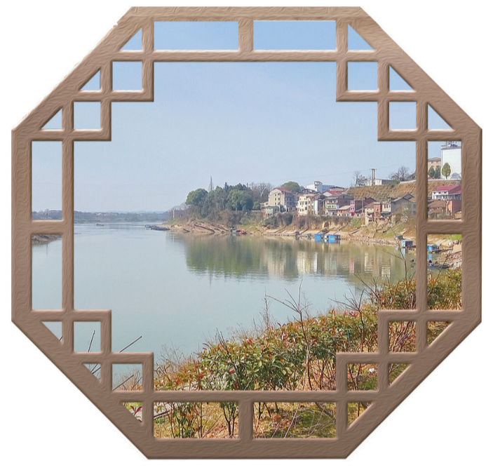
火烧坪看淥口淥江第一湾