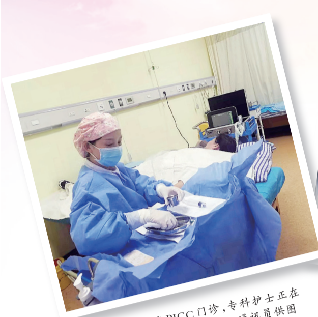
在市中心医院PICC门诊,专科护士正在为病人更换导管。