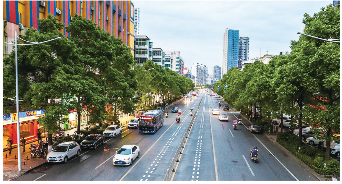
太阳落山时,华灯初上的新华路。