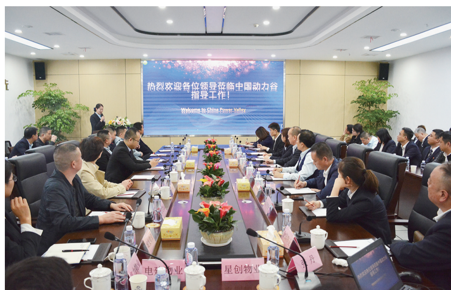
全省物业同行专家专注听取高科物业工作人员关于创建湖南省首个工业园五星示范项目的经验分享。