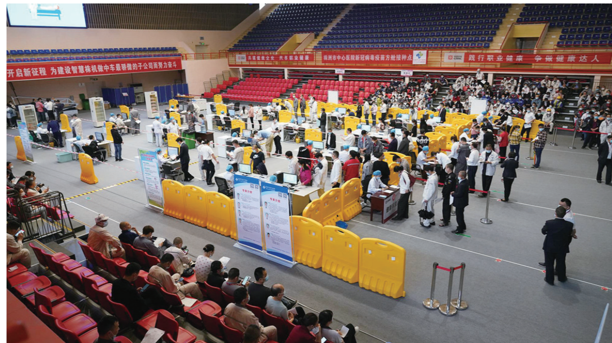
▲前日,全市首个“方舱式”新冠病毒疫苗接种点现场。

本报讯(株洲晚报融媒体中心记者刘琼 通讯员 蒋其洪)我市首个“方舱式”新冠病毒疫苗接种点自4月29日启用后,截至5月8日,已累计接种3万余剂次,运行良好。