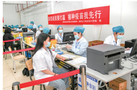
▲在湖南化工职院临时接种点,学生正在接种新冠病毒疫苗。通讯员 何勇 摄

据了解,市职教科技园有近10万师生,云龙示范区制定《分阶段做好各类人群新冠病毒疫苗接种工作方案》,由区卫健局统一部