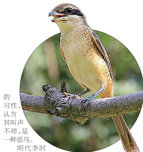
的习性,认为其叫声不祥,是一种恶鸟。

伯劳在古文中记载很多,最初它被称为鵙(jù),也叫作(juè),鵙见于《诗经·邶风》里的“七月鸣鵙”,则见于元代吴澄著的《月令七十二候集解》。伯劳叫鵙,源自它的叫声,至于伯劳这个名字则见于三国曹植的《禽鸟论》。在这篇鸟文里,曹植考证出伯劳就是鵙,又名伯奇、伯赵,因其曝尸猎物的习性,认为其叫声不祥,是一种恶鸟。