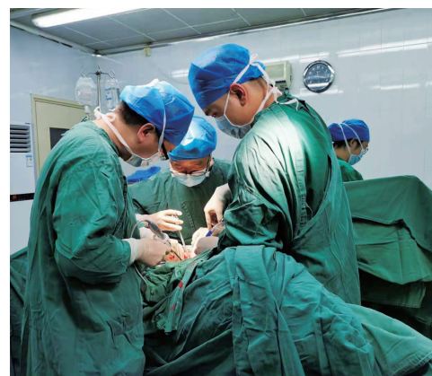
▲市三三一医院普外科专家正在为患者进行手术。

整个“五一”期间,市三三一医院普外科共收治各类急诊病人20人次,胃肠道肿瘤病人4人,其中两位病人因肿瘤梗阻急诊手术治疗(其中一位患者也是85岁高龄,考虑乙状结肠癌并肠梗阻,术后病情平稳)。