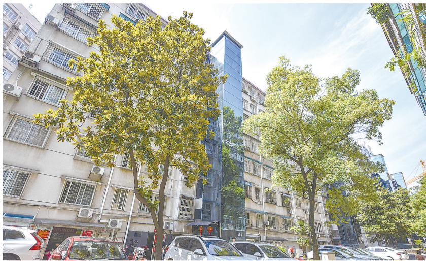
天元区园丁小区加装的电梯

正如硬币有正反两面,“加梯”在为居民生活提升幸福指数的同时,必然迎来不少挑战。今年我市“加梯”工作将如何推进?