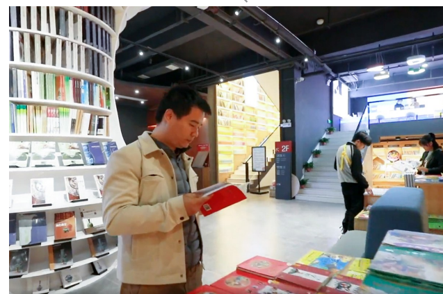
读者在瓷润书城阅读书籍