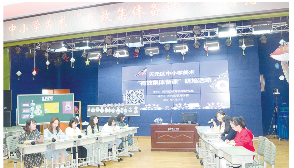
天元区美术老师“有效集体备课”研修现场

株洲日报·掌上株洲讯(记者/孙晓静 通讯员/周芳妮 邝妍) 充分发挥教师的集体智慧,探索提高课堂教学质量的有效途径和方法,促进区域美术教育的均衡发展……4月21日,天元区中小学美术“有效集体备课”研讨活动在银海学校展开。