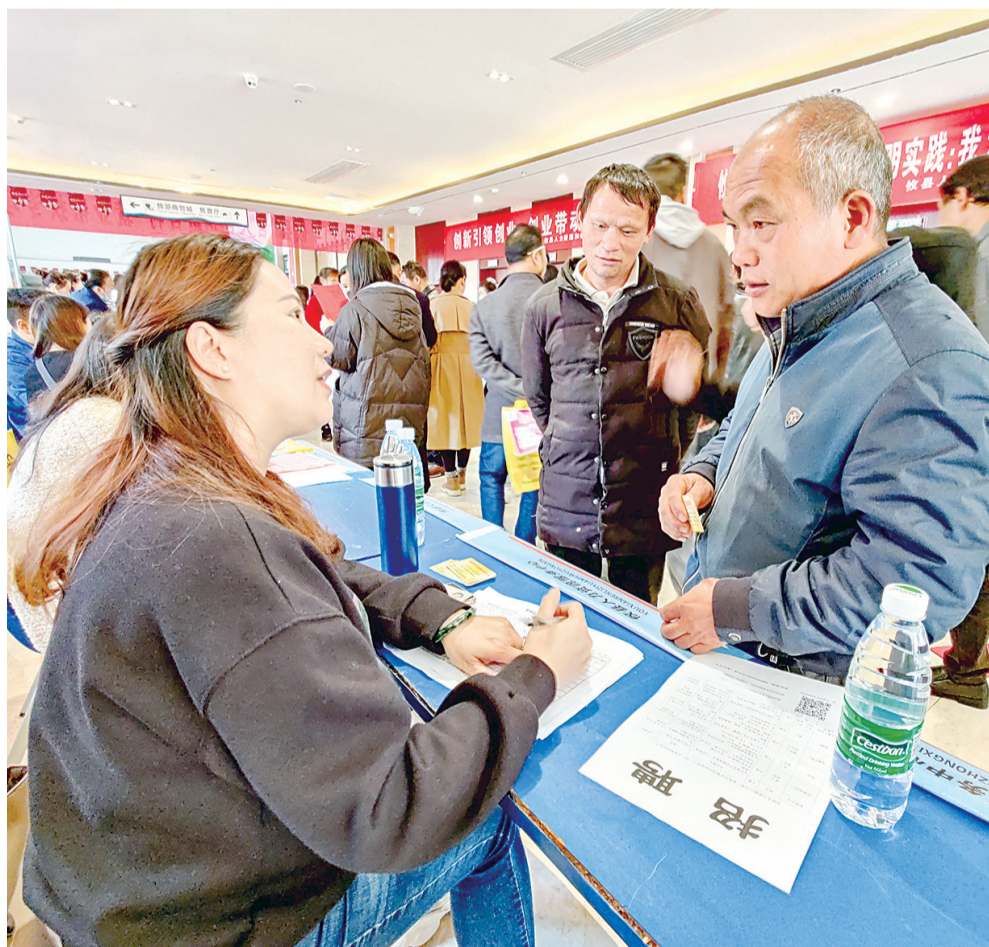
攸县招聘会现场,企业招聘工作人员与求职者交谈甚欢。

“一人就业,全家脱贫。面对面、点对点举办现场招聘会,实际效果比线上招聘要好。”市人社局就业服务中心副主任成沁洪表示,“百人百企进百村”专项行动,不仅让脱贫劳动力在家门口就能找到称心如意的岗位,更重要的是帮助他们树立自立自强的观念,进一步巩固脱贫成果,助力乡村振兴。