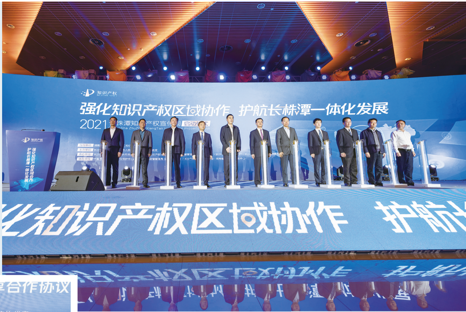
▲长株潭三市2021年知识产权宣传周联合启动仪式现场。

近年来,长株潭区域作为湖南经济发展的核心增长极、长江中游城市群重要组成部分和“三高四新”战略的主阵地,经过多年的努力,已成为全省发展基础最好、资源最密集、创新最活跃的区域。此次三市就知识产权方面展开合作,为长株潭区域一体化发展“加码”,这次合作将从哪些方面开展?能为株洲带来什么?