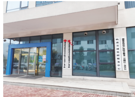
湖南省知识产权综合服务(石峰区)分中心。

立足省级园区,加快创建“湖南省知识产权综合服务分中心”,力争年内再建设3家,总数达到7家。完善市民中心窗口功能,加强合作机构和专家建设,为中小微企业免费定制维权方案,强化涉外知识产权风险防控。持续强化商标注册便利化工程。完善商标注册受理窗口的业务规范,切实发挥好商标注册受理窗口的作用,方便市场主体商标注册申请的申报工作,实现“商标业务全覆盖”。配合上级完善公共服务网络节点,编制公共服务事项清单,统一公共服务标准,提升服务水平。