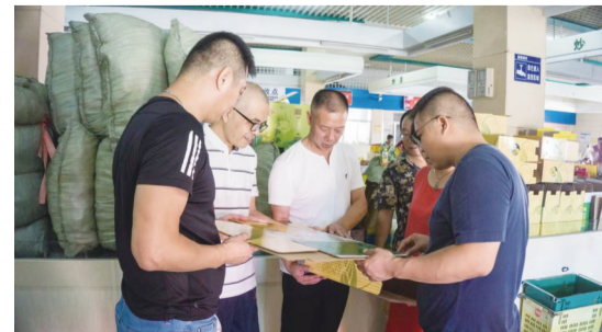
炎陵黄桃知识产权保护行动。(资料图)