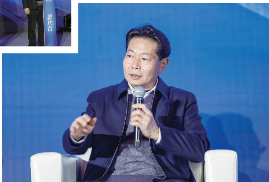
▼市市场监管局党组书记、局长吉振君现场发言。