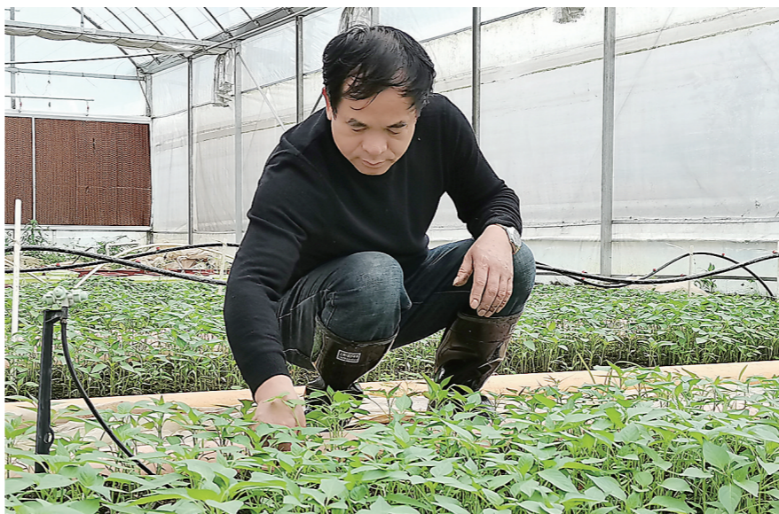
在“现代田园”的温室大棚,工作人员正在查看辣椒苗的生长情况。

从餐桌到农田,如何向源头回溯,倒查农产品的品质?透过一个辣椒,可一窥我市农产品质量安全追溯体系。