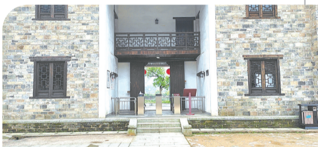
以前秋瑾故居的大门左右两边,都有外置木梯可上去,现在已经看不到了