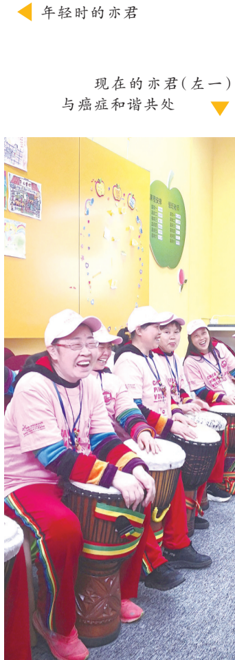
现在的亦君(左一)与癌症和谐共处