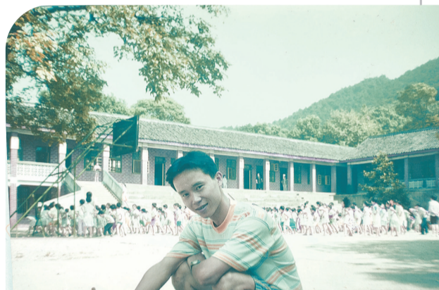
大冲小学。上楼的左边阴影里,是我1976年读小学报名的地方