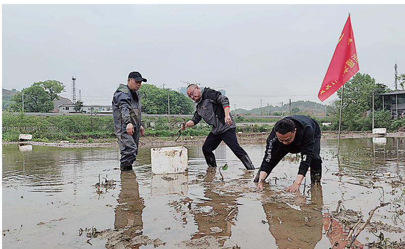
龙泉街道党员干部“变身”为农事志愿者,下地种莲藕。

株洲日报·掌上株洲讯(记者/杨凌凌 通讯员/罗金鹏 欧阳芳) 4月13日,芦淞区龙泉街道组织开展