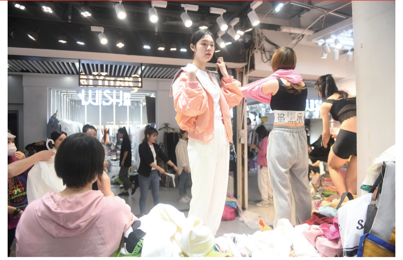
店前就像一个小型T台,小姐姐们站在高凳上快速切换自家的新款。