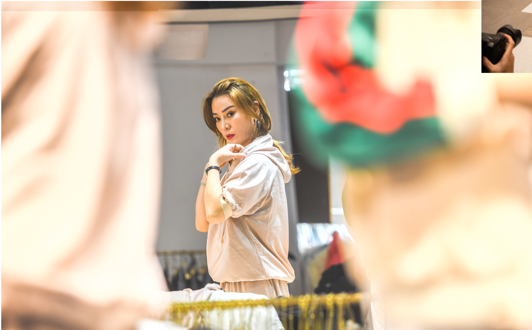
每换一款服装,模特小雅都会迅速的转身对视背后的镜子。