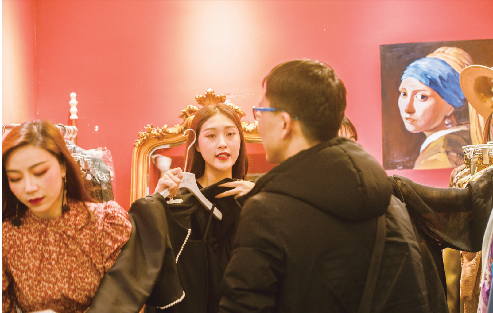
小邹是上届芦淞服装模特大赛冠军,她和两位闺蜜合伙开了一个小店,三位穿版模特开始自己的创业之路。