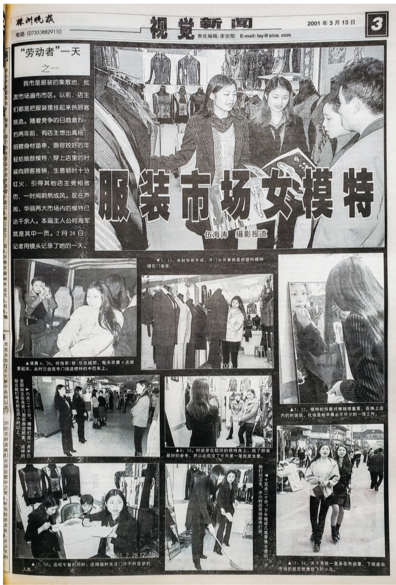
2001年3月的《株洲晚报》视觉版《服装市场女模特》,距今正好20年。