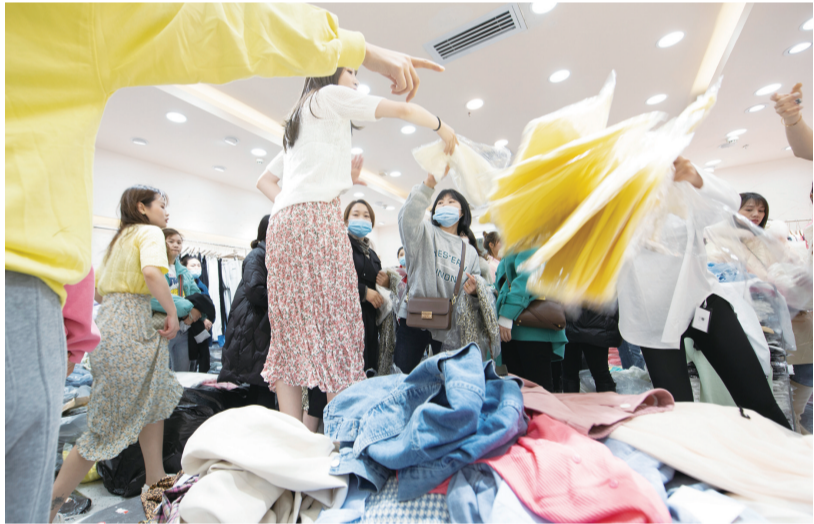
淞北市场,生意火爆的时候,场面就像打仗一样。