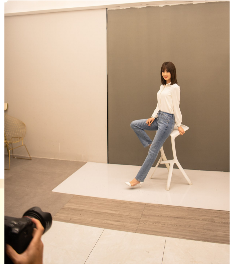
裤模阿卢,从业10多年后脱颖而出,成了有名的裤模,还有了自己的工作室。