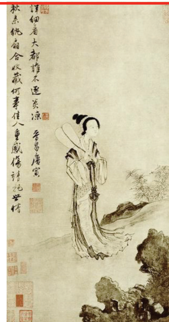
唐伯虎的《秋风纨扇图》

这时的唐伯虎已十分穷困，加上各地农民起义频发，战事连连，全国经济都很不景气，他的画作自然也就少有问津，更卖不起价钱。这样一来，他的生活更是