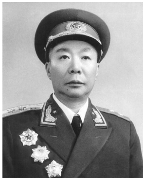
开国中将郭鹏(1906年10月—1977年7月16日)