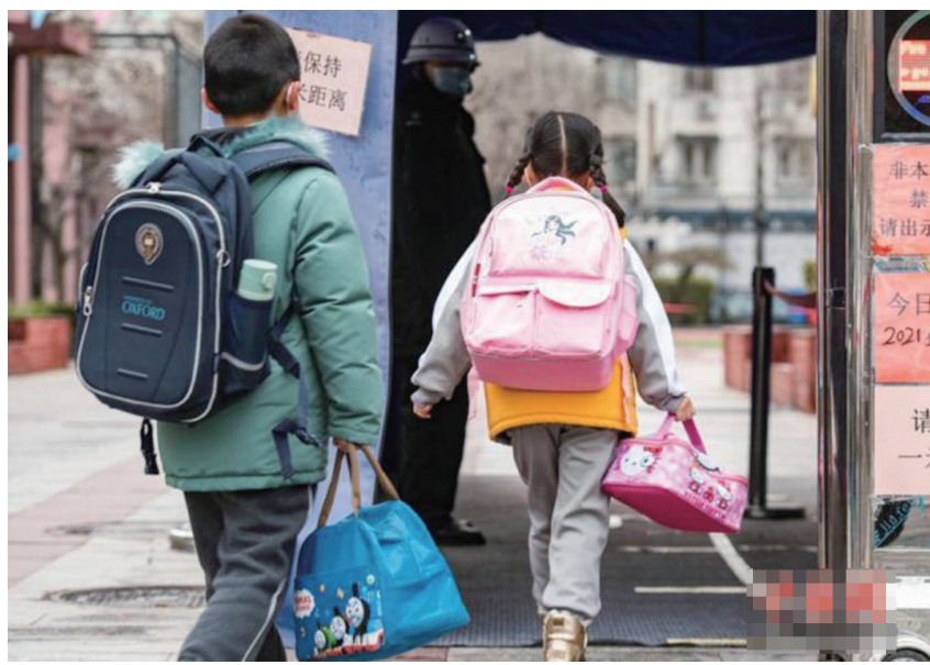
资料图：北京市中小学、幼儿园开学。