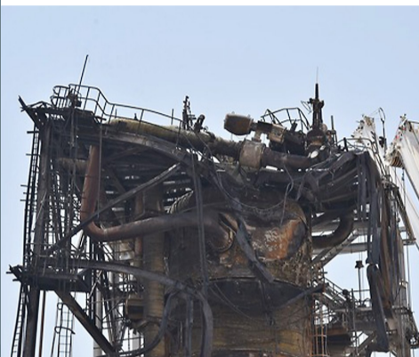
2019年9月20日在沙特胡赖斯拍摄的遭无人机袭击的石油设施。