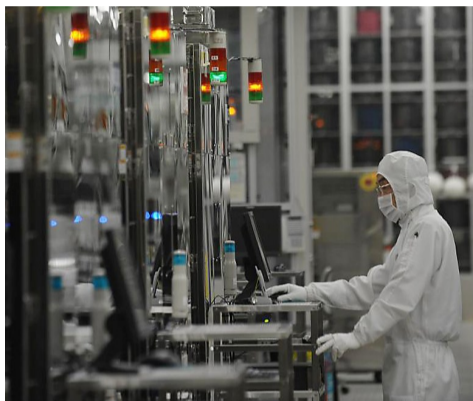
2011年6月10日,工作人员在日本茨城县瑞萨电子公司工厂内工作。

瑞萨火灾及其后续冲击恐拖累第二季度日本国内生产总值7.3个百分点。全球范围内,“芯片荒”悲观情绪更甚。美国芯片制造巨头英特尔公司首席执行官托马斯·考尔菲尔德预计,半导体紧缺将至少持续到2022年才会缓解。除汽车制造外,一些消费电子制造巨头的生产也受到显著影响。