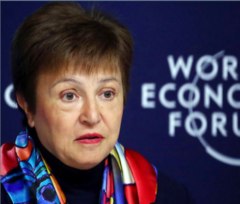
去年11月20日,国际货币基金组织总裁在《世界经济展望》新闻发布会上讲话。