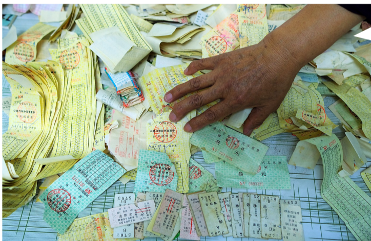
受害人的母亲整理20多年反映问题的信件,乘坐交通工具使用的车票(2020年9月25日摄)。