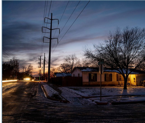
2月18日,大雪覆盖美国得克萨斯州韦科的一处社区。

得州所处的墨西哥湾是全球石化产业聚集地,所生产的聚乙烯、聚丙烯和聚氯乙烯等用途比芯片更广泛,是生产汽车、医疗设备乃至婴儿尿布等产品所必需。