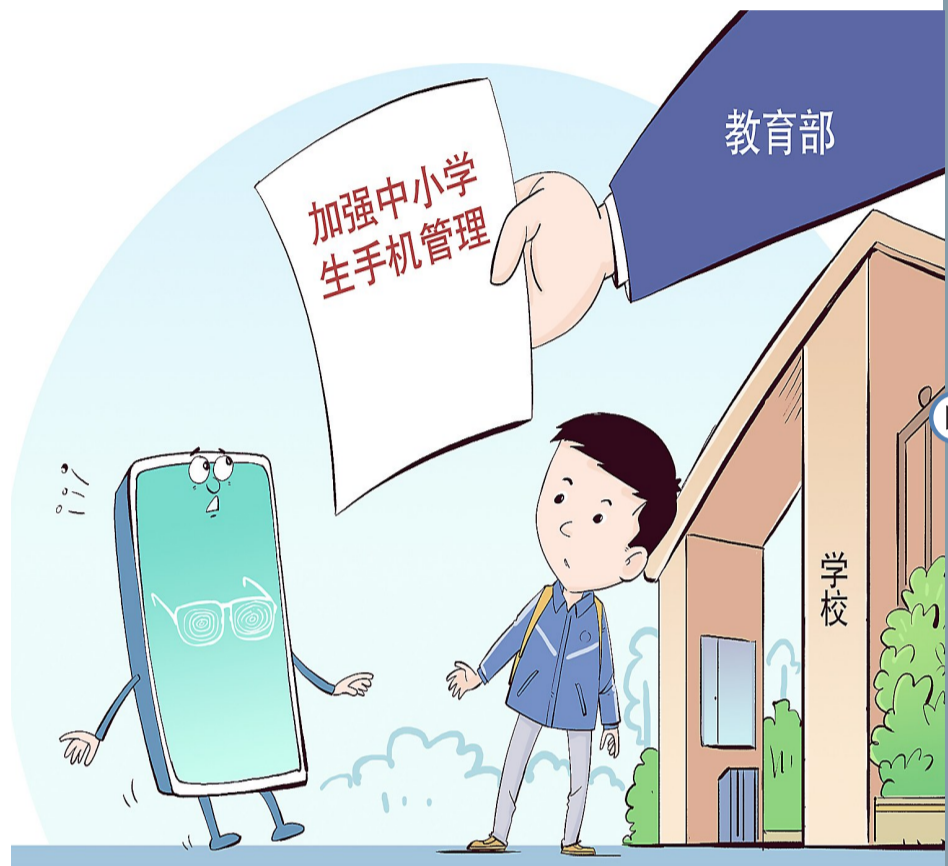
漫画:加强手机管理

学校应当如何科学有效管理学生手机?老师和家长如何引导学生正确、合理利用手机?记者对此进行了有关调查。