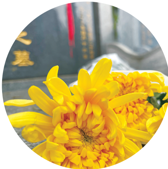
市民用鲜花代替香烛祭奠逝者。

“居家、网络等新的祭扫方式，既表达了心意，也符合环保、文明祭扫新风的要求。”多位市民认为，和以前相比，无论在清明节还是中元节，燃放鞭炮、烧纸钱等传统祭祀现象是越来越少了，新的祭祀方式越来越多了。