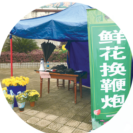
陵园内设立鲜花换鞭炮服务点。

春暖花开，辛丑牛年的春天承载着更多的期许。让我们紧跟时代步伐，文明、安全、绿色低碳祭祀，追思亲人的功德和业绩，继承亲人和先辈的遗愿和精神，争做新时代文明新风的引领者、宣传者、践行者，让绿色和文明成为丧葬永远的底色。