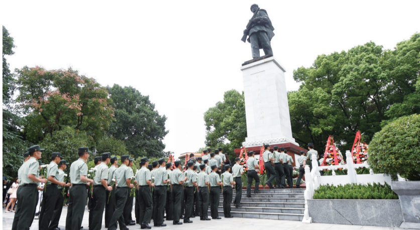
在位于重庆市铜梁区的邱少云烈士纪念馆,武警官兵向邱少云烈士纪念碑献花。