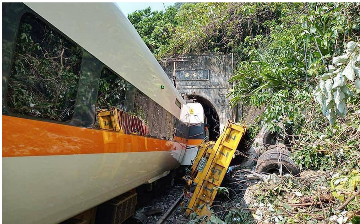
这是4月2日拍摄的事故现场。

表示,事故隧道的旁边有工程进行,疑工程车未拉手刹,停车不慎导致车辆滑落撞向上列车。事发当时工程车上没人。疑肇事的相关负责人已被警方带回侦讯。记者在现场看到,此处工程地点即位于铁路一侧的斜坡上,工地堆满了废弃轮胎等施工设备。台交通事务主管部门负责人当晚来到事故现场,称将尽快抢修完毕事故路段。