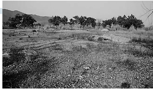
▲民国时期,茶陵国民政府向各乡征用修建小汾机场工具的电文 ▲茶陵小汾机场旧址

机场旧址位于涠溪镇小汾村。该机场是国民党四十四军兵营、辎重营等直属部队2000多人,与茶陵警察中队、涠溪乡民工700多人共同于1944年8月至9月间修筑的。机场跑道长1000米、宽60米。能容纳多架飞机起降,并有较完善的航空站、兵棚、无线电台等后勤保障设施。