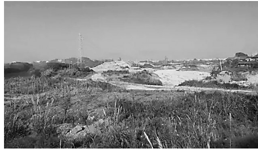
茶陵鲤鱼洲机场旧址 ▲民国时期,茶陵飞机场航务组印鉴

茶陵“界三路之间”,扼湘赣要冲,历为兵家盘踞和必争之地。新中国成立前,国民党鉴于茶陵的特殊区位和军事需要,在茶陵修建两个飞机场,使远离中心城市、地处湘东一隅的茶陵成为交通、军事中心。