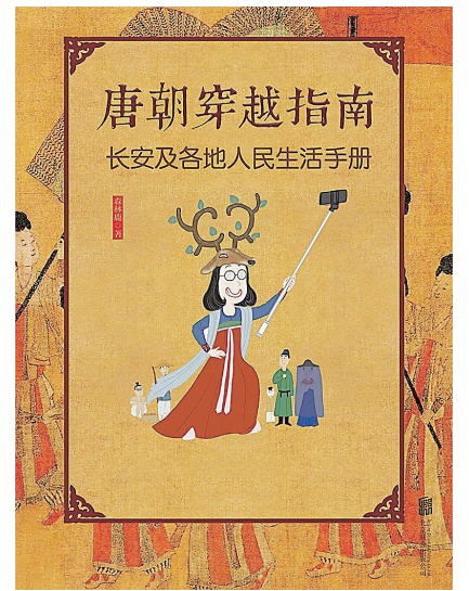
唐朝穿越指南 长安及各地人民生活手册

跳跃着,赤膊的胡人师傅打着烧饼;蒸笼里的白汽热腾腾上冒;刚出炉的芝麻胡饼金黄酥亮,又香又脆;带馅的蒸饼一咬喷香流油;大碗的软面片馄饨(bōruǎn,古代一种水煮的面食)汤要加酸还是加辣由你随意。而且在唐朝,主人杀掉自己养的马或者牛,要服一年苦役,也就是说国家禁止杀死