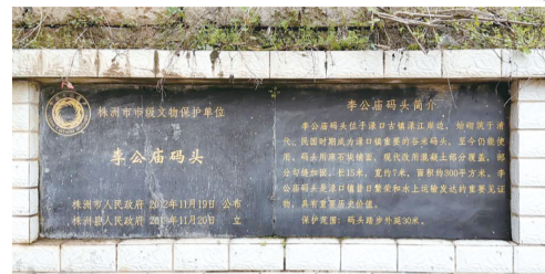
李公庙码头2012年被列为株洲市文物保护单位