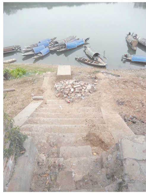
花岗岩垒砌的宏伟堤岸