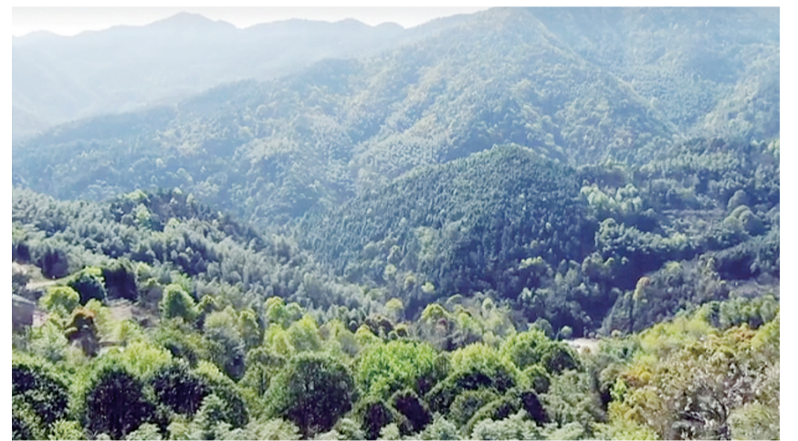
俯瞰王仙镇李山村。