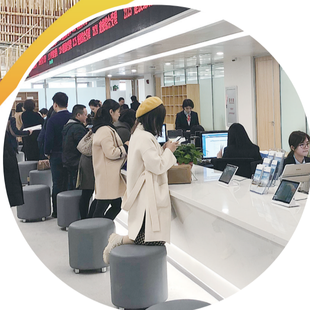
建设综合受理窗口人来人往

在工程建设审批改革这场持久战、攻坚战中,株洲交出了“高分答卷”,为全省的工程建设审批制度改革开先河、立标杆。