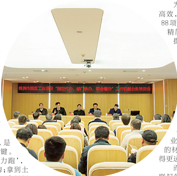
株洲市社会投资园区工业项目“指定代办、部门快办、联合督办”工作机制业务培训会

给审批环节做“减法”,切实提高效率,有利于降低制度性交易成本,使企业将精力放在市场调研、资金筹措、建设、设备采购、工艺流程优化上。同时,也能有效减少政府部门和工作人员的“寻租”空间,消除滋生腐败的土壤。