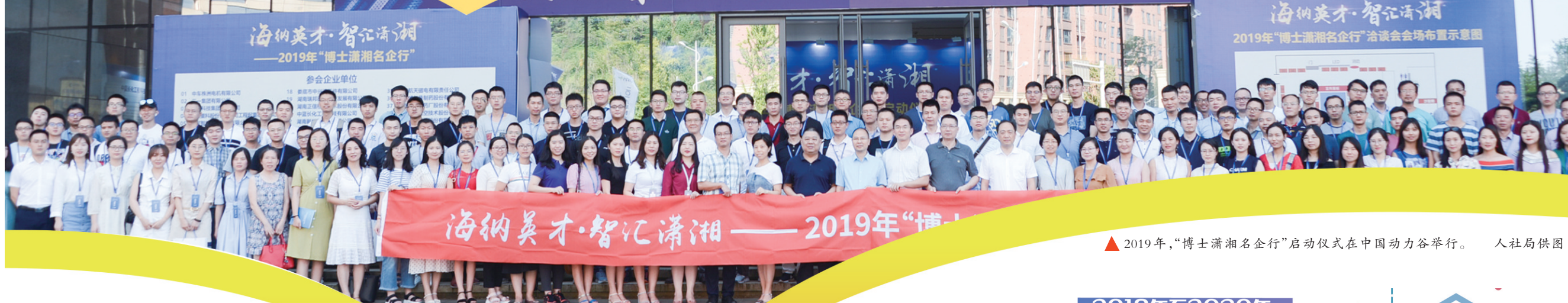
▲2019年，“博士潇湘名企行”启动仪式在中国动力谷举行。