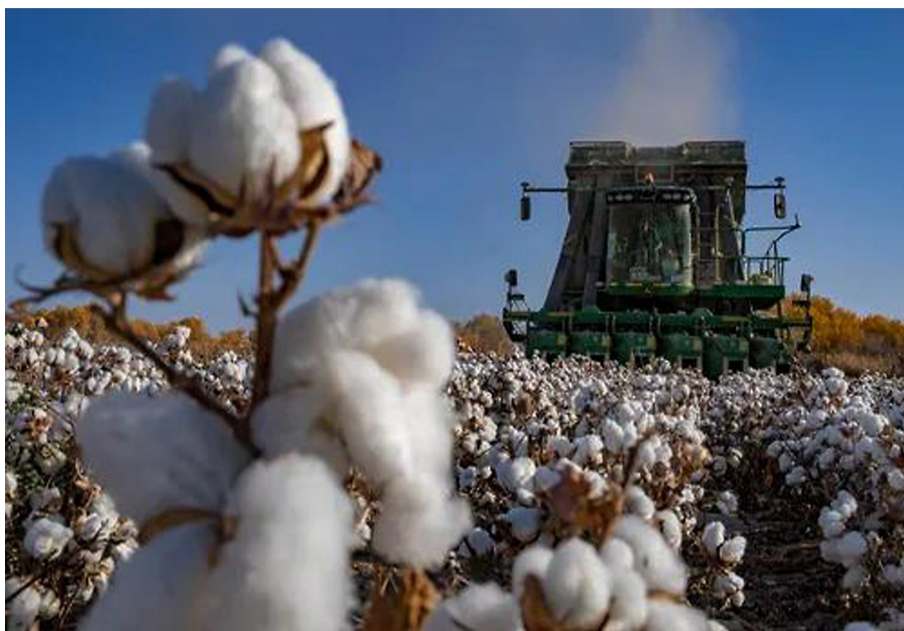
采棉机在新疆阿克苏地区沙雅县的一处棉田进行采收作业(2020年10月23日摄)。

骗、愚弄国内外广大消费者;反对伪造事实、限制采购、歧视供应,侵害消费者对优质原料和产品制成的终端消费品的自主选择权;反对在华销售商品、赚取利润,却伤害中国消费者的民族感情、人格尊严。相关行业组织和跨国企业应立即停止实施类似虚假宣传、歧视政策、损害消费者合法权益的做法,立即纠正不诚信、不公平、不道德的商业行为,真正担负起跨国企业应尽的法定责任和社会责任,以实际行动体现对中国消费者的尊重。